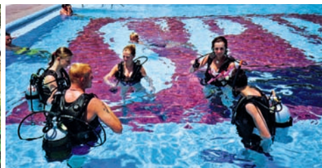
Vchod do školy a kurz potápění ve školním bazénu