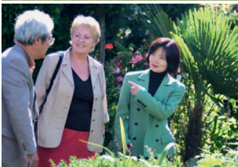
Park v Bournemouthu, senioři na výletě, budova školy, výlet na Stonehenge, výuka a prohlídka zahrady