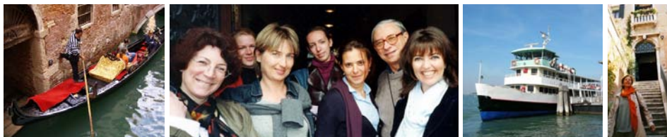
Benátky, studenti školy, loď a vchod do školy.