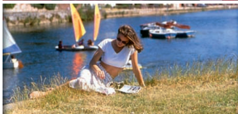
Pláž nedaleko Exeteru, hostitelská rodina, zahrada školy a studentka školy Globe English Centre