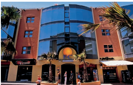
Studenti školy u bazénu a budova školy EC Malta