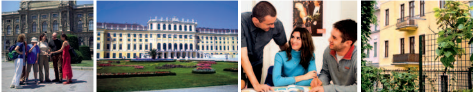
Aktivity ve Vídni, zámek Schönbrunn, výuka a budova školy Actilingua