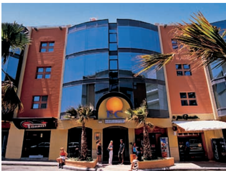
Výuka a budova školy EC Malta