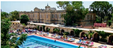
Vchod do školy, výuka, výuka mimo třídu a pohled na areál školy Sprachcafe