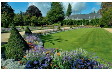
Budova školy, studentka ve společenské místnosti, výuka a Jardin les Plantes